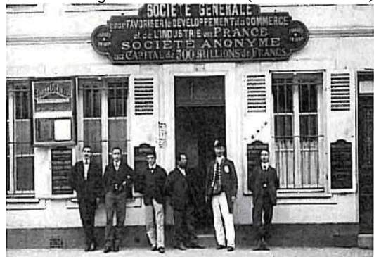
1906. Une agence à Montereau (Seine-et-Marne).

Malgré les crises financière et politique de la fin du second Empire, le nombre des agences continuent d'augmenter, passant en 1870 à 32 dans les régions et à 15 dans la région parisienne. On compte 130 guichets en 1879.