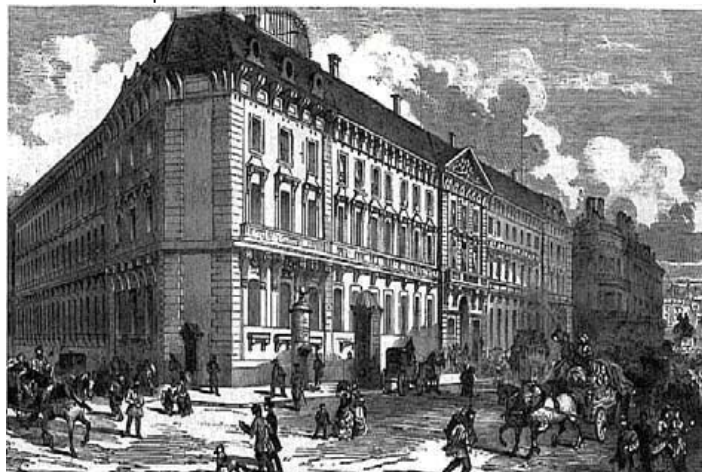
La Banque de France vers 1860. Gravure de Sweeton.

Leurs activités se répartissent d'abord entre opérations commerciales et opérations bancaires, nécessairement liées, puis se développent dans les investissements industriels et permettent à la banque d'atteindre son apogée. Elles connaissent, enfin, des difficultés quand l'environnement financier évolue, la concurrence de nouveaux établissements et de nouvelles méthodes réduisant l'attrait des banques privées.